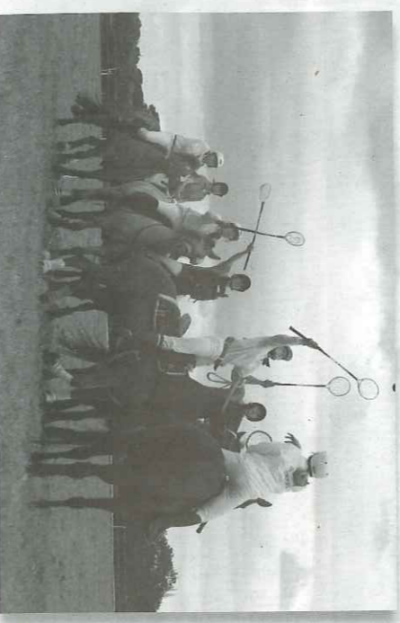
Foto: Line up Nederland tegen Frankrijk, Doncaster mei 2006

De eerste Nederlandse polocrosse-club bestaat sinds 2005. De sport heeft echter al een veel langere historie. Omstreeks 1983 werd het spel bekend als een oefening om jonge ruiters spelenderwijs vertrouwd te maken met de paarden en ze op deze manier beter te leren rijden. In 1939 werd in Engeland de eerste polocrosse-club ter wereld opgericht.