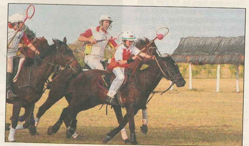
Actiemoment tijdens een wedstrijd polocrosse.